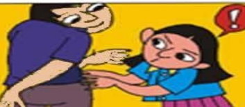
AZARLAMAYA, İTİLMEMEYE KARŞI KENDİMİZİ KORUMAK