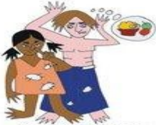
Çocuğa yeterli bakım sağlamamak, ör: Kirli, çıplak, aç bırakmak