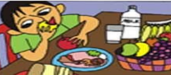
BESLEYİCİ GIDALAR YEMEK