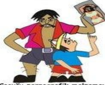
Çocuğu pornografik malzemeye veya davranışlara maruz bırakmak