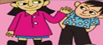
UYGUN ELBİSELER GİYMEK