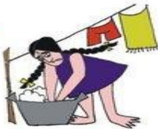
Çocuğu hizmetçi gibi kullanmak