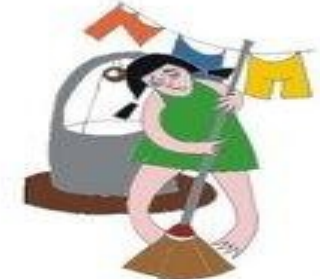
Başka işler yaptırarak çocuğun eğitim ve hobileri için kullanacağı zamanı harcamak