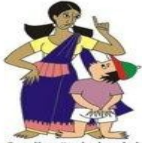
Çocuğu sözel olarak hırpalamak