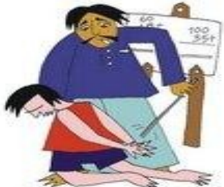
Kulda çocuğa vurmak veya aşağılamak