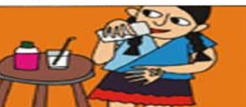
GEREKTEĞİNDE İLAÇ ALMAK