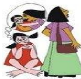
Çocuğun duygusal gereksinimlerini göz ardı etmek