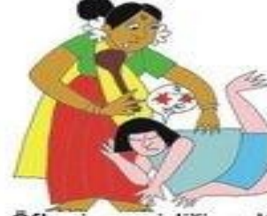
Öfkeyi, gerginliği azaltmak için çocuğu örselemek, itip kakmak