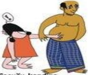
Çocuğu kendine dokunmaya zorlamak