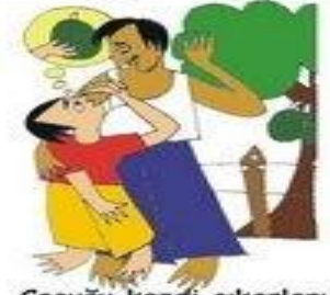
Çocuğu kendi çıkarları için kullanmak