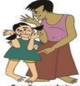
Çocuğu gereksiz yere ağlatmak