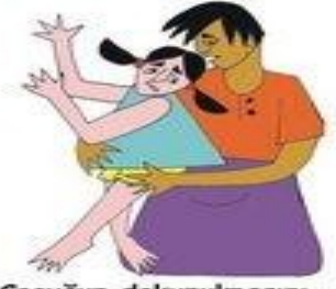
Çocuğun dokunulmasını istemediği yerlerine dokunmak