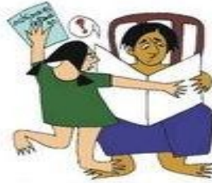
Çocuğun özgüvenini kırmak