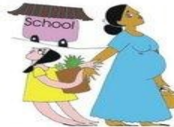
Çocuğun eğitim gereksinimlerini göz ardı etmek