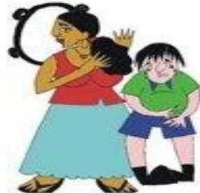
Çocuğun tıbbi gereksinimlerini göz ardı etmek